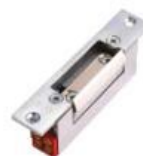
Elektrický zámek 1 495,- Kč