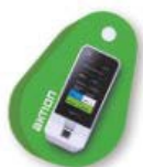
Klíčenka Mifare 49,- Kč / ks